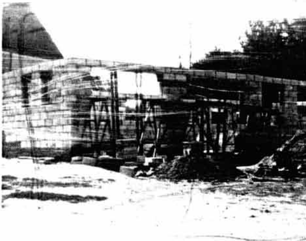
Na zdjęciu: parter domu strażaka wybudowany wczesną wiosną 1988r.